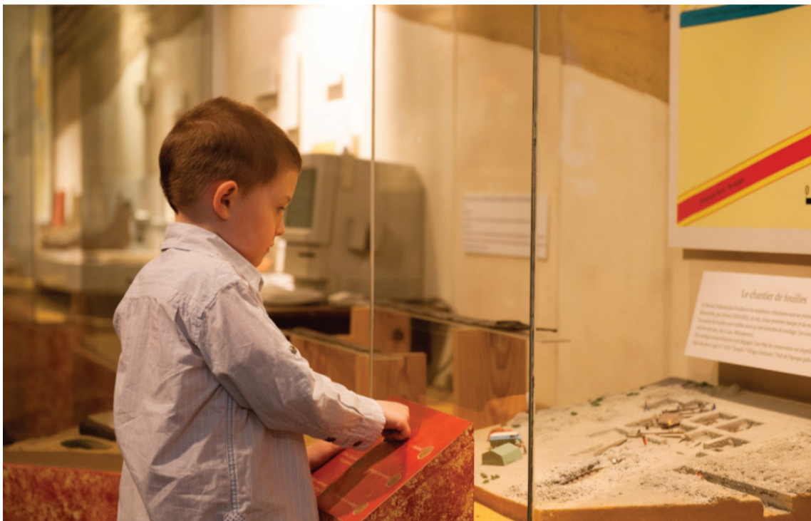
À l'Espace gallo-romain, c'est très jeune qu'on apprend à aimer d'où l'on vient.

A u centre de toutes les préoccupations des équipes pédagogiques, le jeune public est très souvent chouchouté dans les musées. Visites et activités surprenantes, ludiques ou créatives pensées en fonction des âges et des compétences de l'enseignement : tout y est mis en œuvre pour adapter le musée à chaque petit visiteur.