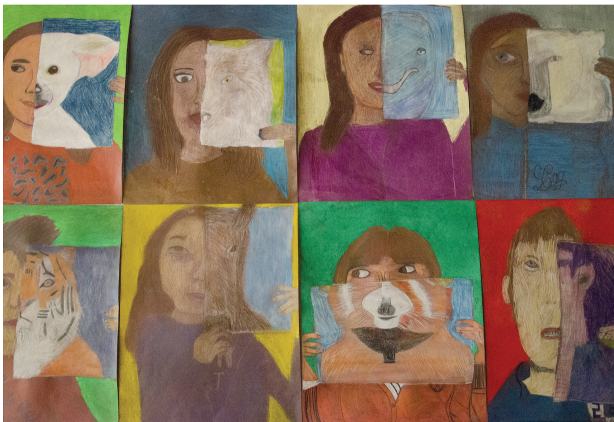
Atelier d'enfants - École des arts de Braine l'alleud