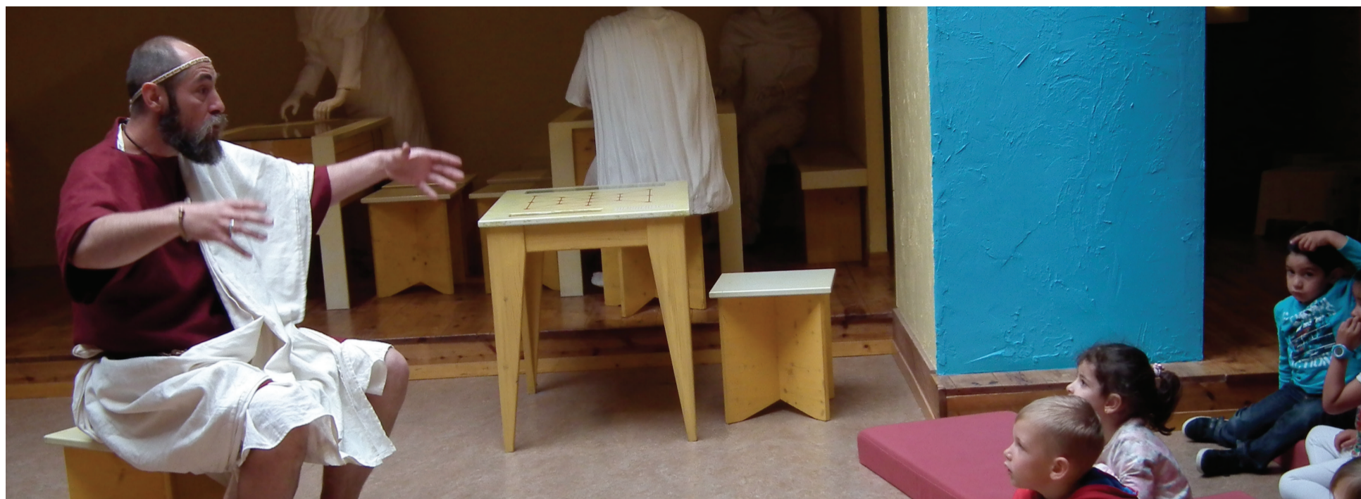
L'Espace gallo-romain d'Ath.