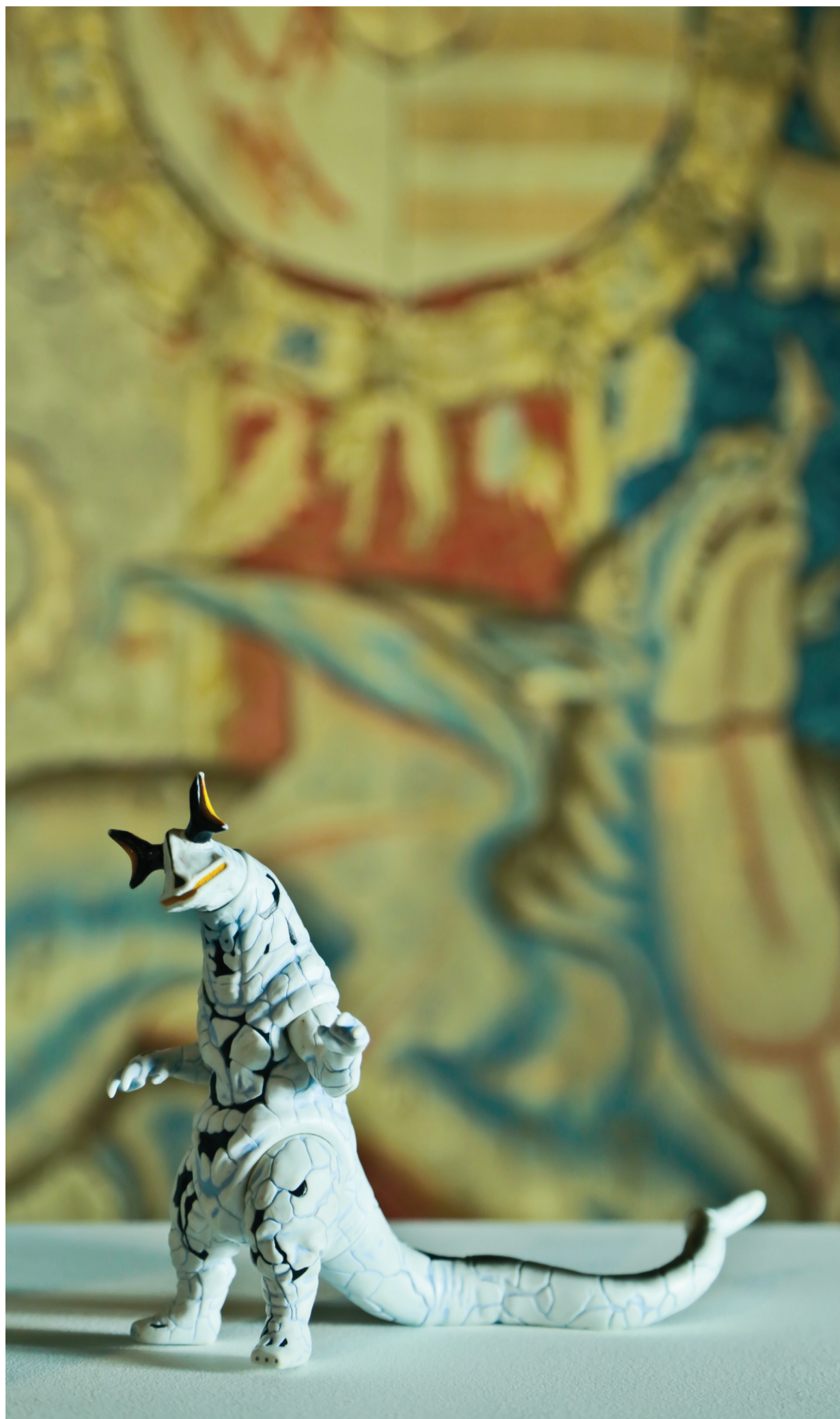
Mononoké & Tapisserie héraldique « Les armes d'Adrien de Croy Melun ». Exposition « aRTnimal: les tissus de nos démons »

Informations: Tél. +32(0)69/234.285 info@tamat.be www.tamat.be