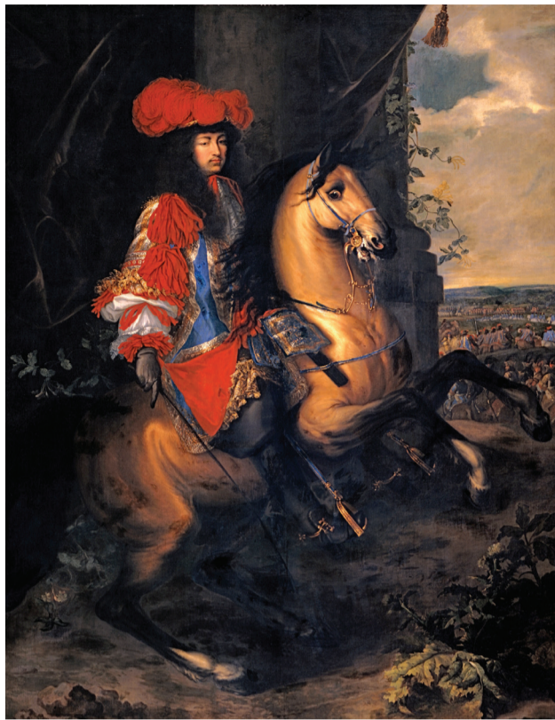
Portrait équestre de Louis XIV, 1668, Charles Le Brun

à 12h et de 14h à 17h. Fermé le mardi et dimanche matin. Fermé les 25 et 26 décembre 2015 et les 1 er et 2 janvier 2016. www.tournai.be