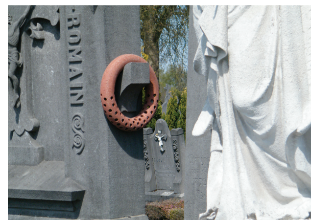
Couronne d'artiste