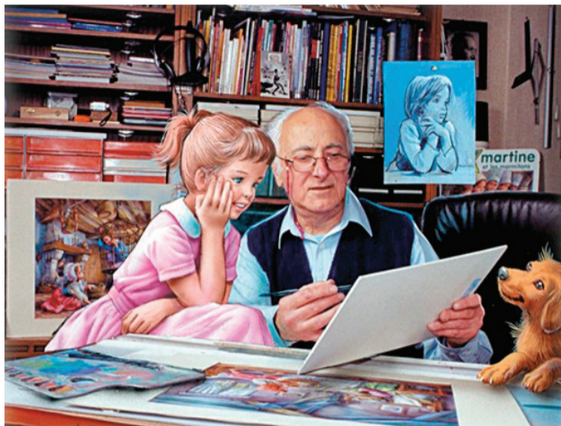
Martine et Marcel Marlier, son créateur