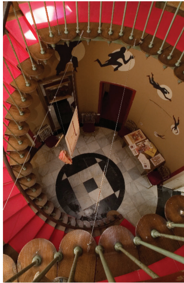
Musée des Arts de la Marionnette

Composez votre propre personnage de super-héros et imaginez ses aventures sur le mode d'une bande dessinée animée en vous inspirant des marionnettes les plus populaires d'Europe et d'Asie. 6 ans et plus. Infos et réservations au 069/88 91 40 - maisondelamarionnette@skynet.be . www.museedesartsdelamarionnette.be