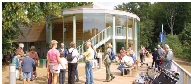
PNPE ©Samuel Dhote

La Maison du Parc naturel sera particulièrement mise en exergue. Elle accueillera des expositions, et offrira aux visiteurs des visites et événements particuliers. L'occasion de montrer tout le dynamisme de ce territoire ! Le programme complet de ces manifestations sera disponible sur le site internet : www.plainesdelescaut.be en janvier 2016.