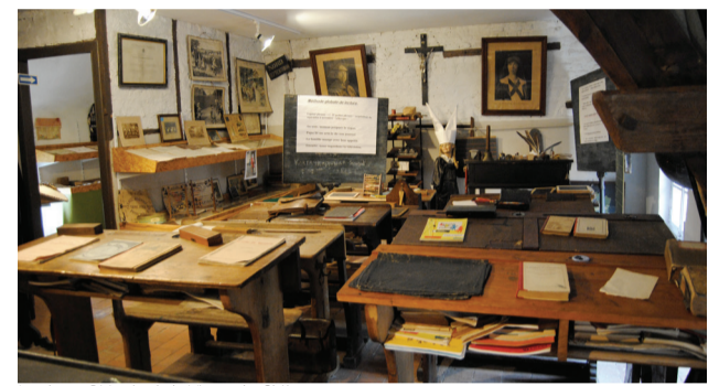
La classe

et sur facebook.com/museedelavieruralehuissignies