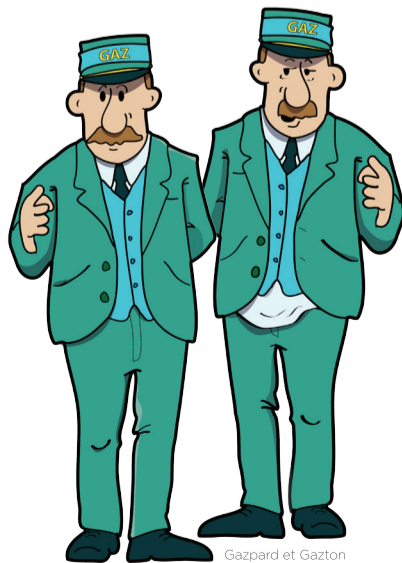
Gazpard et Gazton

Accessible à tous (individuels, familles et groupes). Questionnaires adaptés. Nombreux prix à gagner ! 2,5€/adulte 1,25€/enfant, étudiant 2€/senior, 6€/famille 2€/scolaire (musée+parcours). 056/86 04 66 - musee.folklore@mouscron.be www.mouscron.be/musee