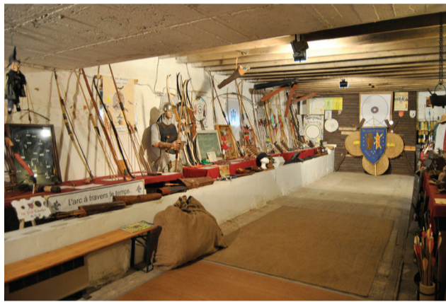
Salle d'exposition