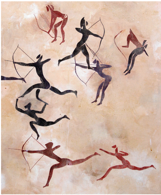
Chasseurs de la Préhistoire africaine

de 14h à 18h. En week-end de 14h à 18h30. 8,5€/adulte 7,5€/senior, 6€/étudiant, enseignant, demandeur d'emploi 3,5€/enfant 5€/lessinois. Fermeture annuelle du 22 décembre 2015 au 4 janvier 2016. L'accès au musée donne gratuitement accès à l'exposition. www.notredamealarose.com