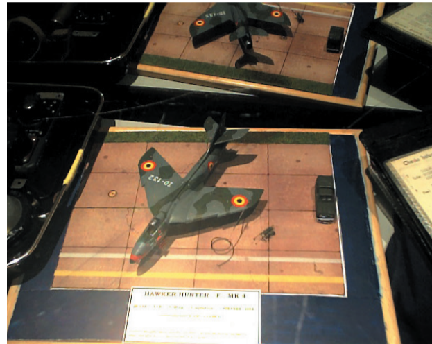
Pièce du Musée