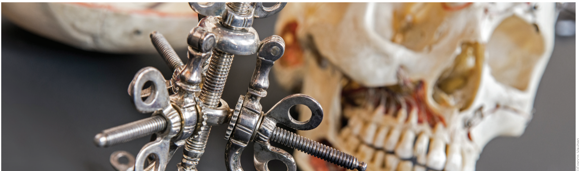
Exposition D'Ambroise Paré à Louis Pasteur, un grand cabinet de curiosités, Hôpital Notre-Dame à la Rose, Lessines (page 6)