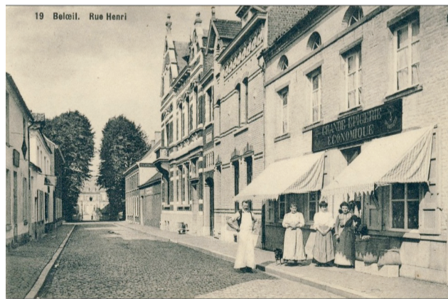
Belœil - Carte postale ancienne

À 14h, salle «La Grange» de Belœil 3€ pour les membres (abonnés à «Coup d'œil sur Belœil»), 5€ pour les non-membres. http://users.skynet.be/ASPB.Belœil