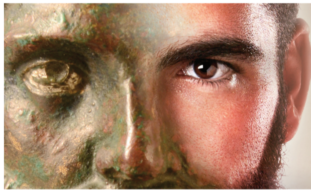
Rome en pays nervien - Affiche de l'exposition

Rendez-vous à 14h à la Maison du Patrimoine, rue du Pont, 4-6, Comines (France). Départ 14h30. Entrée gratuite sur réservation au 056/58 77 68