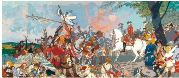
De Fontenoy à Waterloo. Affiche de l'exposition.

2,6€/individuel 2,1€/groupes, senior, jeunes 1€/scolaire. Horaire d'hiver (à partir du 1 er novembre) de 9h30 à 12h et de 14h à 17h. Fermé le mardi et dimanche matin. Fermé les 25 et 26 décembre 2015 et les 1 er et 2 janvier 2016. 069/21 19 66 www.tournai.be