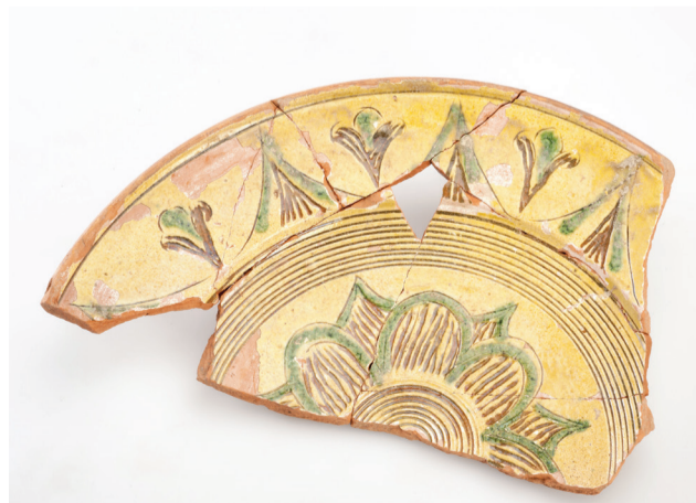
Assiette décorée de motifs végétaux stylisés à sgraffiato, 17-18 ème siècle, Chièvres, rue Hoche

Un colloque sera organisé le dimanche 7 février 2016. Une visite guidée de l'exposition sera proposée les dimanches 20 décembre 2015 et 17 janvier 2016 à 15h. D'autres peuvent être organisées sur réservation. www.ath.be/loisirs/culture/musees