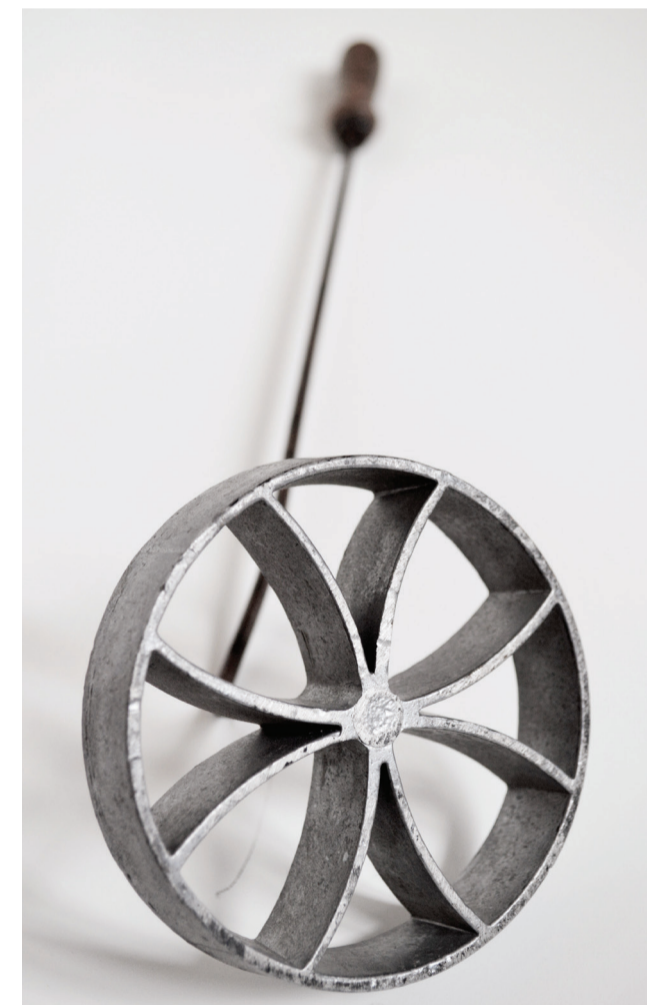
Fer à Beignets

40 objets insolites à identifier ! 40? L'âge de l'Écomusée... Une visite ludique, à la recherche des temps perdus et à venir du Pays des Collines! Ouvert toute l'année du lundi au vendredi, de 10h à 16h30. Fermé le samedi et durant les vacances d'hiver. 3€/adulte 2,5€/senior ou habitant du Pays des Collines 1,5€/enfant. www.ecomusee.eu