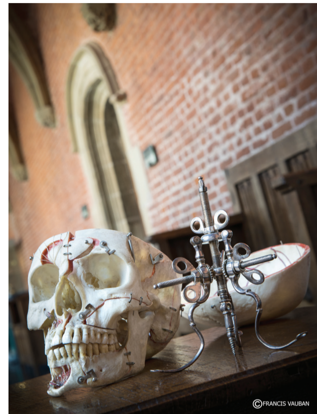
D'Ambroise Paré à Louis Pasteur

Exposition accessible du mardi au vendredi, de 14h à 18h. Le week-end et jours fériés, de 14h à 18h30. Visites guidées sur réservation (de 9h à 18h) sauf le lundi. www.notredamealarose.com - 068/33 24 03