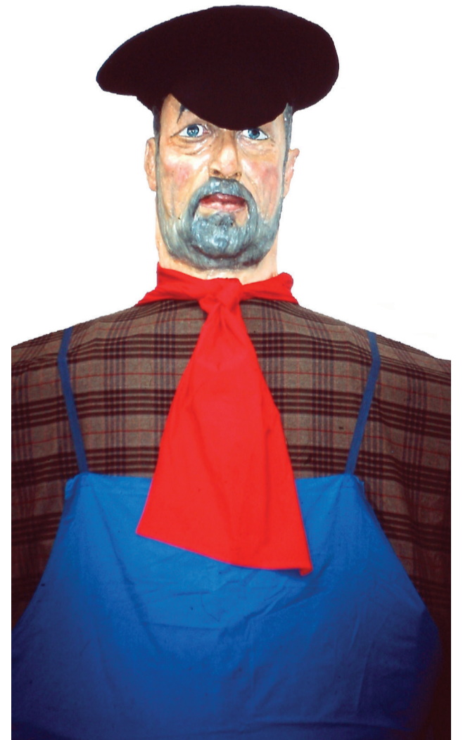
Simon le Rubanier

Par ailleurs, d'autres activités connaissent un sommeil en attendant peut-être de renaître un jour, à l'image de la fête des épeuteurs ou de celle des lumières, dont les moments forts nous sont connus par des documents d'archives. Cependant, une chose demeure incontestable : le marmouset cominois sait comment faire rimer travail et fêtes ! Ouvert tous les jours (sauf fériés) du mardi au vendredi de 9h à 11h30 et de 13h30 à 16h30. 3€/adulte 1€/PMR et enfant (6 à 12 ans) gratuit/enfant - 6 ans. Visites sur rendez-vous au 056/ 58 77 68 ou larubanerie@yahoo.fr http://larubanerie.wordpress.com