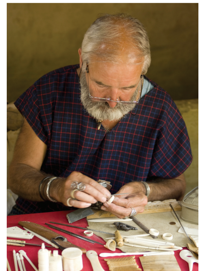
Taille de fos