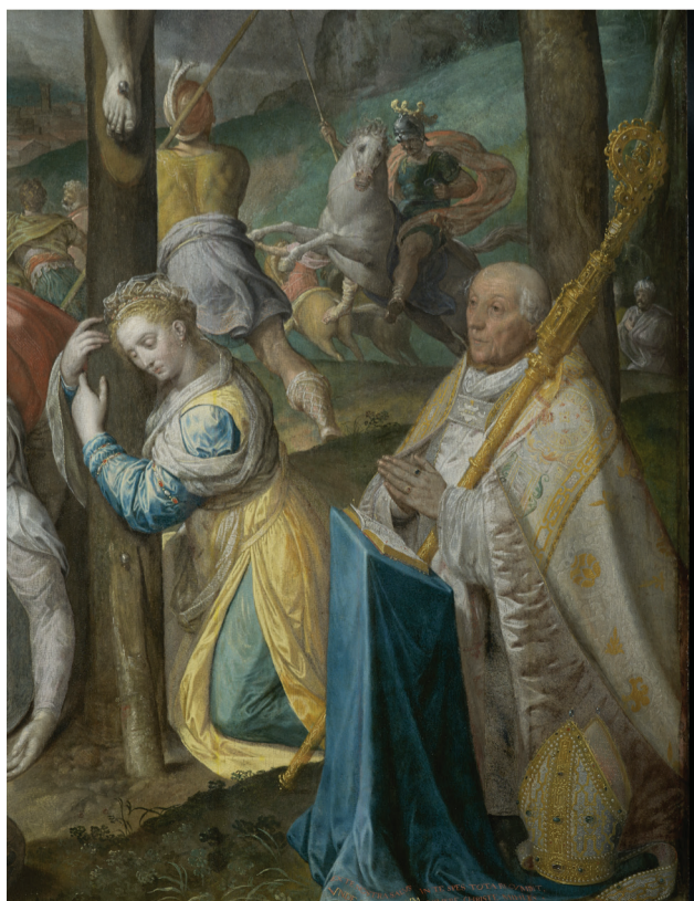
François Pourbus l'Ancien, Le Christ entre les larrons, 1574

Musée au 1 er étage. Visites guidées exclusivement, sauf le dimanche matin et le lundi. Renseignements et inscription obligatoire à l'Office du Tourisme de Tournai. 069/22 20 45 - info@visittournai.be www.visittournai.be