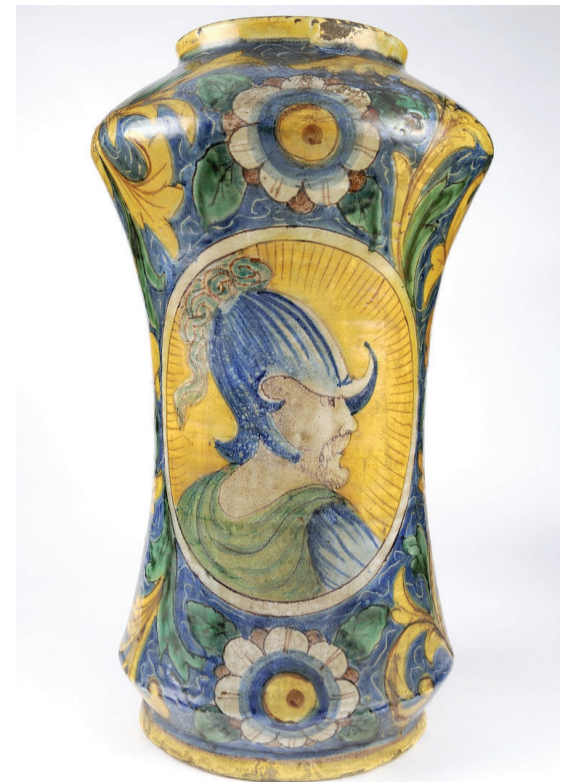
Couvreur 2012 © Benoit Sneessens