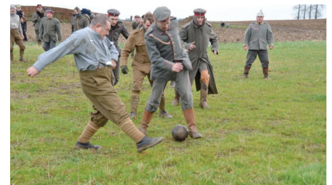
Reconstitution de la Trêve de Noël, 2014

Lieu : Chemin du Mont de la Hutte (Warneton) Possibilité de visiter le Centre d'Interprétation Plugstreet 14-18 (à 2 km) - 056/55 56 00