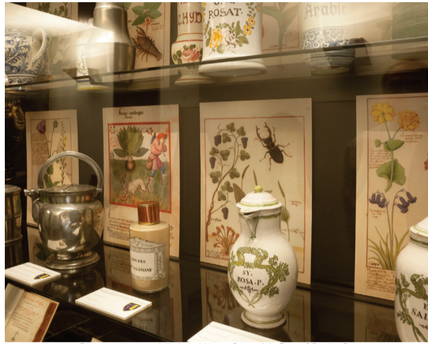
Les Hospices de Beaune s'invitent à l'Hôpital Notre-Dame à la Rose

de 14h à 18h. En week-end de 14h à 18h30. 8,5€/adulte 7,5€/senior, 6€/étudiant, enseignant, demandeur d'emploi 3,5€/enfant 5€/lessinois. Fermeture annuelle du 22 décembre 2015 au 4 janvier 2016. L'accès au musée donne gratuitement accès à l'exposition. www.notredamealarose.com