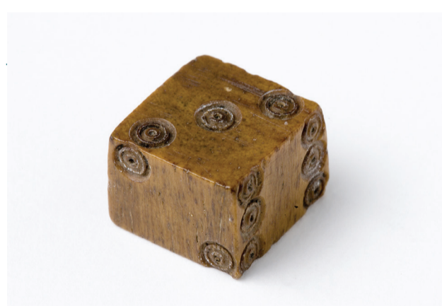
Dé en os provenant de Pommerœul

6€/adulte 5,5€/senior et PMR 5€/étudiant et enseignant 14€/ticket famille (à p. de 3 personnes) www.ath.be/loisirs/culture/musees