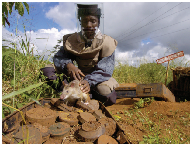
Un rat de Gambie sur des mines antipersonnelles

C'est la toute première fois que tableaux, orfèvrerie, meubles, vaisselle, tapisseries, statues et objets du quotidien traversent la frontière française. Ces objets permettent de mettre en évidence les similitudes entre les deux hôpitaux historiques, les Hospices de Beaune et l'Hôpital Notre-Dame à la Rose. La qualité exceptionnelle du patrimoine conservé dans ces deux institutions rend cette exposition incontournable. Tous les jours de la semaine (sauf les lundis non fériés),