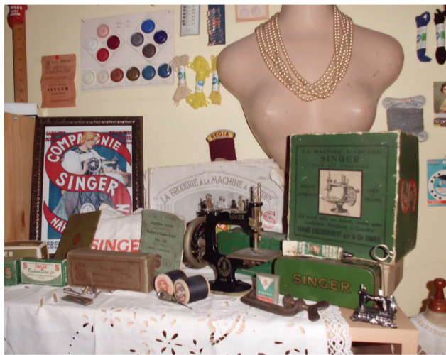
Pièces du musée

2€/personne. Groupes de +/- 10 personnes. Visites combinées avec le parcours-spectacle de la Maison du Pays des Collines ou avec le musée de l'archerie à Wodecq.