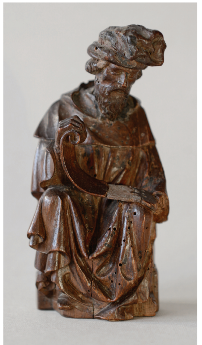
Prophète assis